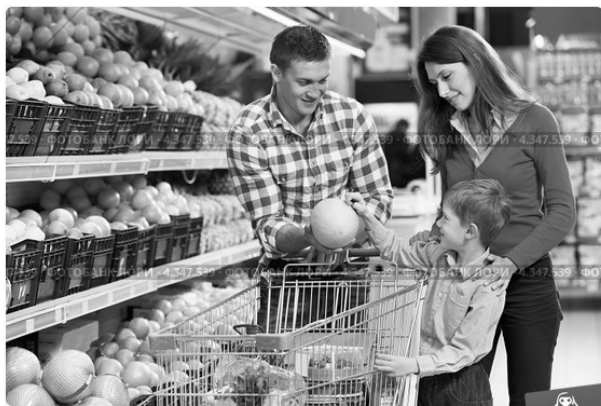
Семья выбирает продукты в супермаркете