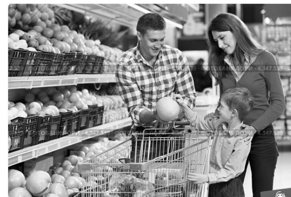
Семья выбирает продукты в супермаркете